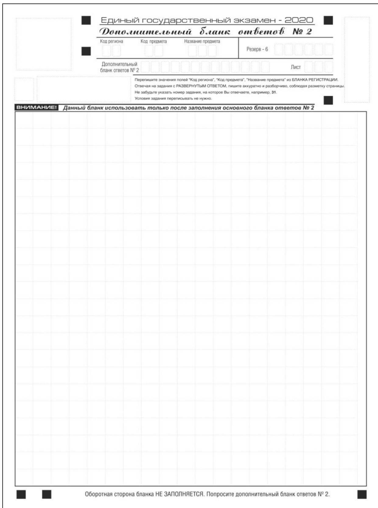
Рис. 16. Дополнительный бланк ответов № 2 по китайскому языку