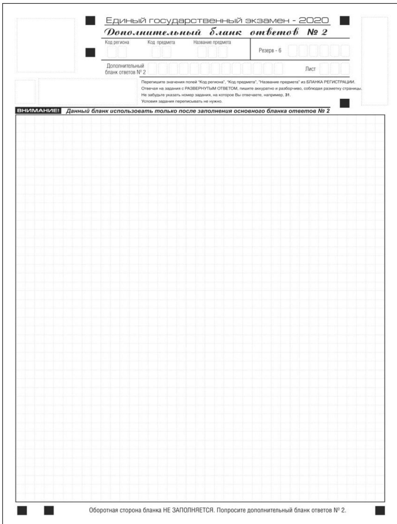
Рис. 15. Дополнительный бланк ответов № 2