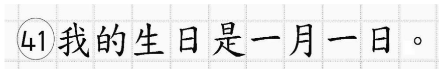
Рис.14. Образец написания иероглифических знаков

иероглифический знак и каждый знак препинания следует писать внутри отдельной клетки области ответов бланка ответов № 2 (дополнительного бланка ответов № 2) (рис. 14).